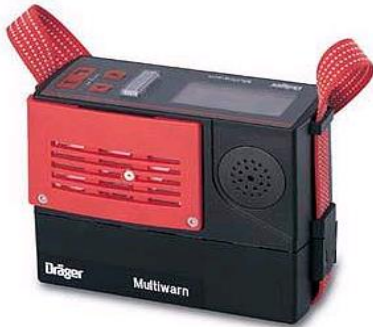
Multi-gas detector O_2 , CO , CH_4 , SO_2