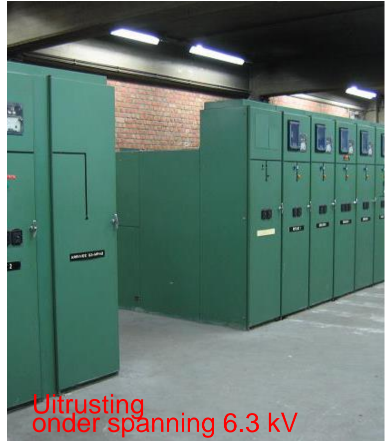
Uitrusting onder spanning 6.3 kV