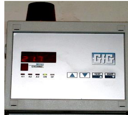
Vaste O_2 -meter