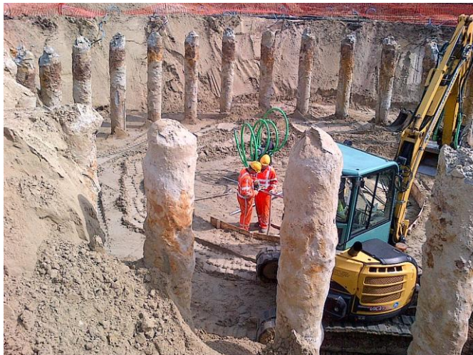
GENK : uitgraven van de werkput; de paalfundering is zichtbaar

Eind 2014 heeft Electrabel n.v., samen met haar partners, het startschot gegeven voor de bouw van vijf nieuwe windparken in Vlaanderen. Hierbij een aantal foto's over de uitgevoerde werken.