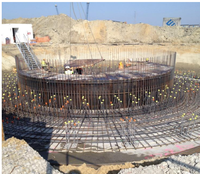
GENT HAVEN: wapenen van de funderingssokkel