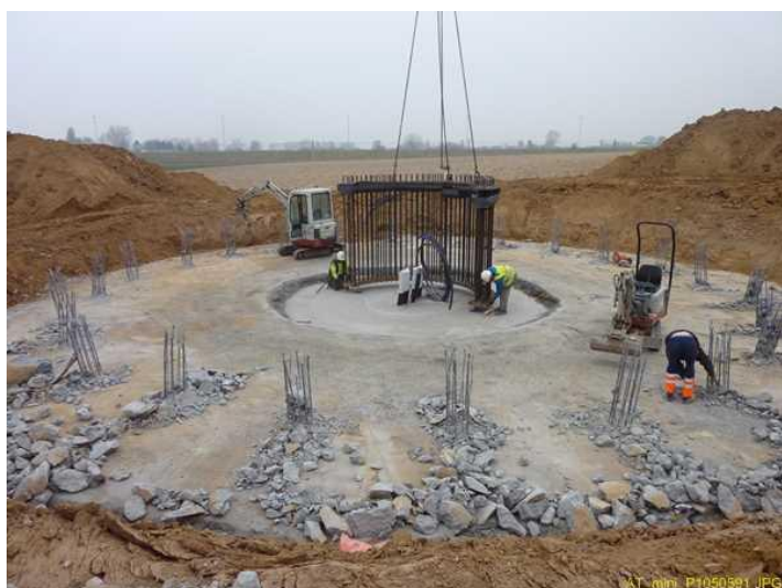
WUUSTWEZEL: plaatsen van de "anchor cage"