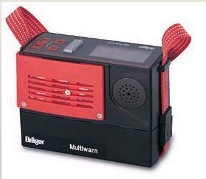
Détecteur Multi gaz O 2 , CO, CH 4 , SO 2