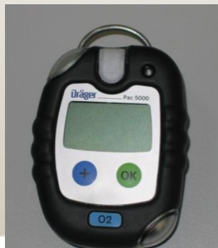
Détecteur O 2