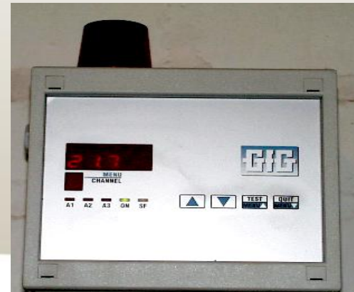
Mesureur permanent d'O 2